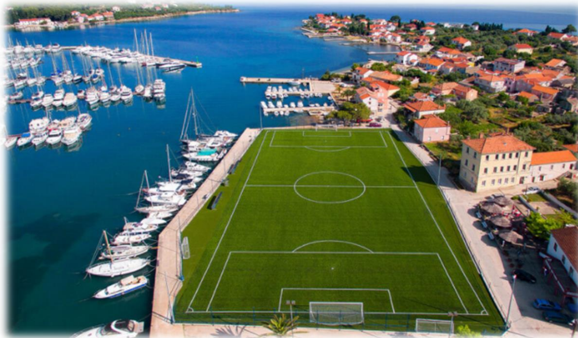
Slika 1. Igralište na Foši, teren NŠK-a Sveti Mihovil

Općina Preko u svom vlasništvu ima jedno nogometno igralište, Foša. Općina Preko ne održava niti ostvaruje rashode za održavanje nogometnih igrališta u svom vlasništvu ili suvlasništvu, već to čine nogometni klubovi na njihovom području, o čemu tijekom revizije nije pribavljena dokumentacija.